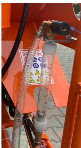
Rotametr 150 l. Regulacja u góry