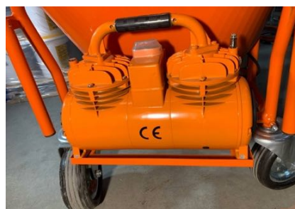
Kompresor osłonięty przezroczystą matą.